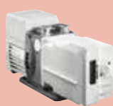
Pascal 2021 SD