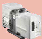
Pascal 2010 SD